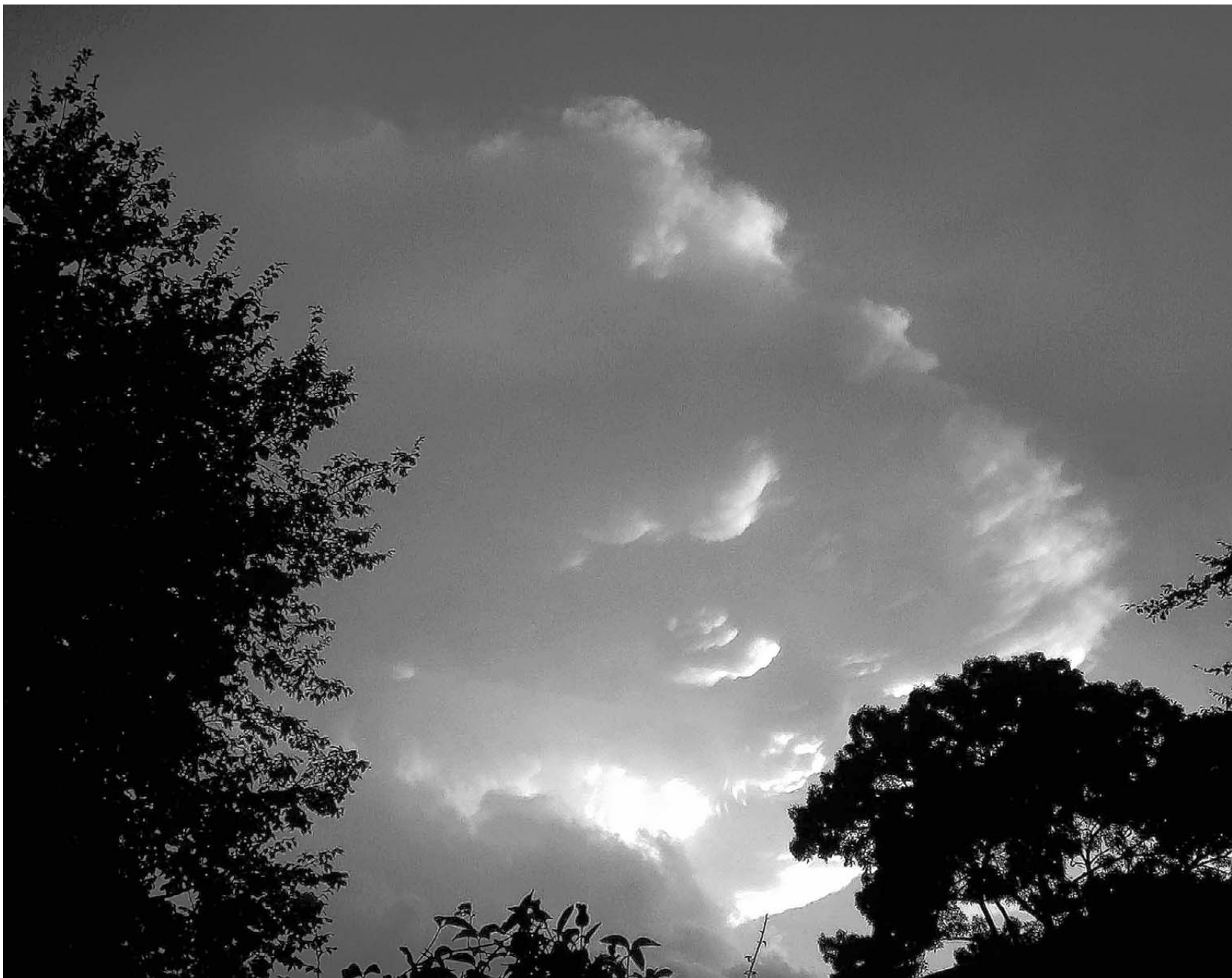
De uitzakkingen onderaan de wolk treden volgens Dick slechts incidenteel op bij fel onweer.

De weersite van Dick is de afgelopen week zeer druk bezocht door Zoetermeesters. „Normaal worden we gemiddeld 600 keer aangeklikt, met extreem weer wel 1600 keer.” En extreem was het weer de afgelopen maand met hittegolven en tropische regenbuien. Dick wordt er niet zenuwachtig van. „Dat de aarde opwarmt is een feit”, zegt hij nuchter. „Hoe het weer en het klimaat gaan veranderen, daarover spreken de geleerden elkaar tegen. De vele regen van de laatste weken komt door het warme zeewater. Als daar relatief koude noordenwinden overheen gaan, ontstaan makkelijk felle buien. En als die buien ook nog eens blijven hangen, heb je wateroverlast. Het is heel plaatselijk. Laatst sloeg de bliksem in in mijn weerstation aan de Chromstraat, terwijl de